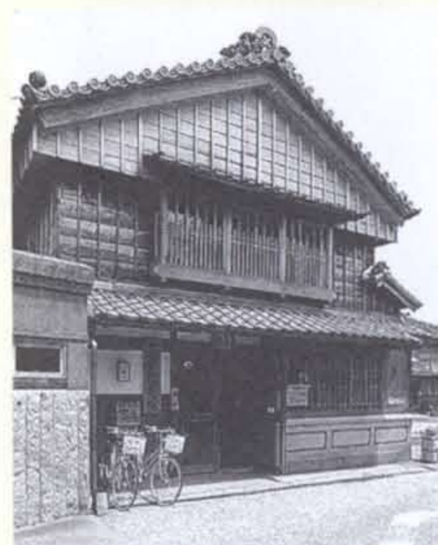
伊勢河崎商人館 母屋

伊勢河崎商人館 江戸時代に創業された酒問屋『小川酒 店』は、川に面した蔵を持つ河崎を代表 する商家です(平成13年、国の登録有形文 化財に登録)。その建物を伊勢市が修復 整備し、平成14年に伊勢河崎商人館とし て再生。NPO法人伊勢河崎まちづくり 衆が運営管理を行っています。